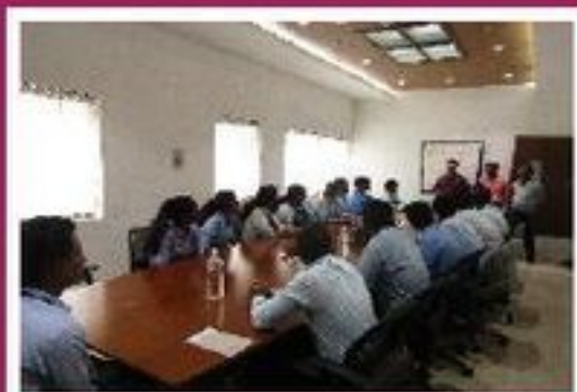
Jindal (India) Limited