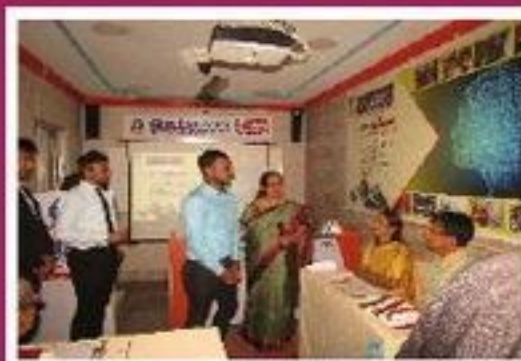
Khosla Electronics Pvt Ltd