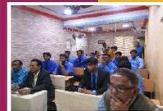
Usha Capacitors Ltd.