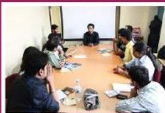
Varun Beverages Ltd